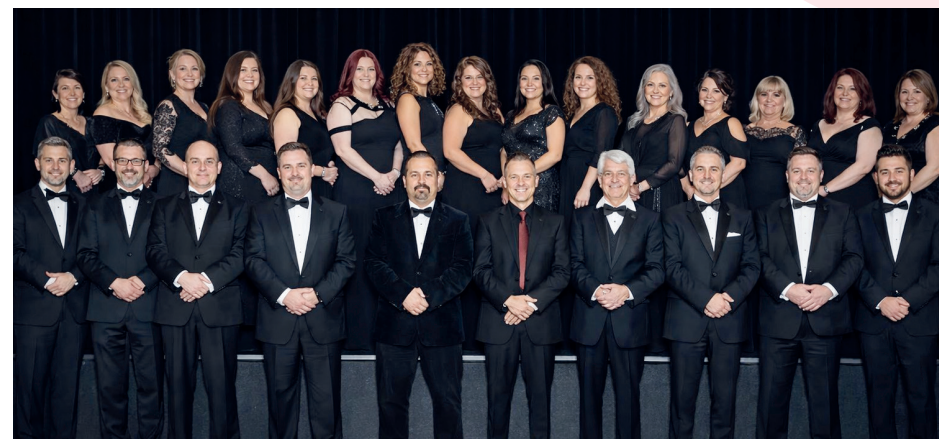
Chor des Mannheimer Musik Kulturvereins (MKD)

Wo? Bürgerhaus Viernheim, Kreuzstr. 2 Wann? 10.05.2026, Einlass 16:00 Uhr, Beginn 17:00 Uhr Eintrittskarte: 15 € im Vorverkauf 20 € an der Abendkasse Vorverkauf: Lernmobil, Stiftungshaus, Rathausstr. 32 Happy Döner, Rathausstr. 31 Lernmobil, Am Schlangenpfad 3